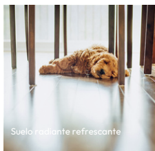
Suelo radiante refrescante