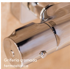
Grifería cromada termostática