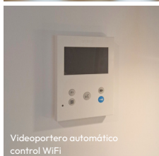
Videoportero automático control WiFi