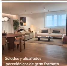
Solados y alicatados porcelánicos de gran formato