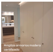
Amplios armarios madera certificada