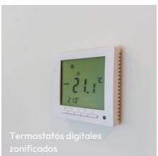
Termostatos digitales zonificados