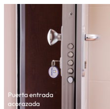
Puerta entrada acorazada