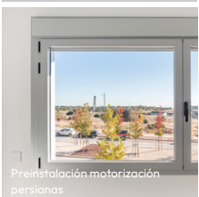
Preinstalación motorización persianas